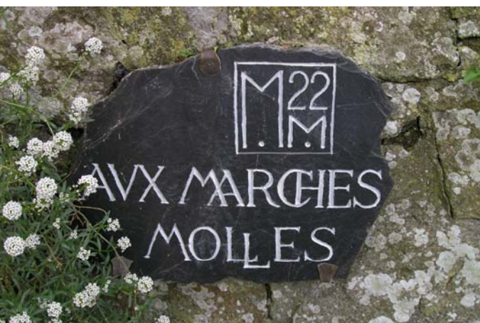
toutes les photos de ce document ont été prises lors des sorties précédentes

DESISTEMENTS APRES LA DATE LIMITE D'INSCRIPTION : SOIT LA PERSONNE QUI ANNULE APRES LA DATE LIMITE D'INSCRIPTION TROUVE UN REMPLAÇANT ET RECUPERE SON CHEQUE D'ARRHES, SOIT LES SOMMES ENGAGEES PAR LA SECTION SONT RETENUES (150 €).