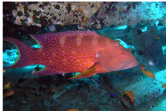
Un habitant du Thistlegorm

En fonction de l'heure de départ, possibilité, moyennant un supplément à régler sur place, d'avoir une chambre de transit (à titre indicatif : 5€ jusqu'à 19h – 8€ jusqu'à minuit). Vol Hurghada/Paris.