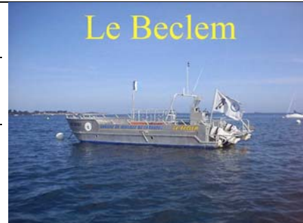
(UN BATEAU DE CARANTEC PLONGEE)

Les blocs NITROX sont des 12 litres long