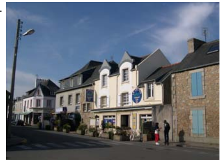
HOTEL LE RELAIS

Pour t'inscrire, utilise le coupon réponse accompagné d'un chèque d'arrhes de 150 €, A L'ORDRE DE L'ASCEA-GR SPORTS SOUS-MARINS.